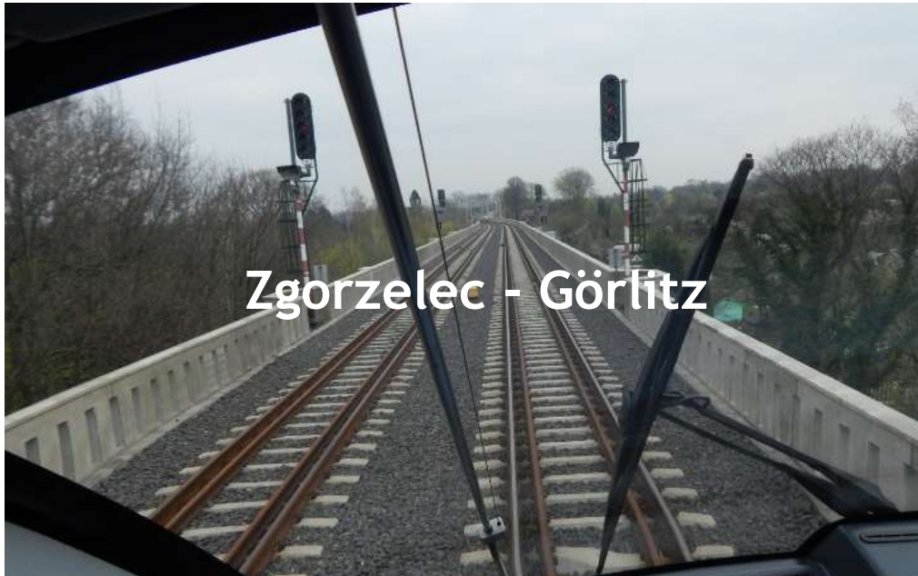
Zgorzelec - Görlitz