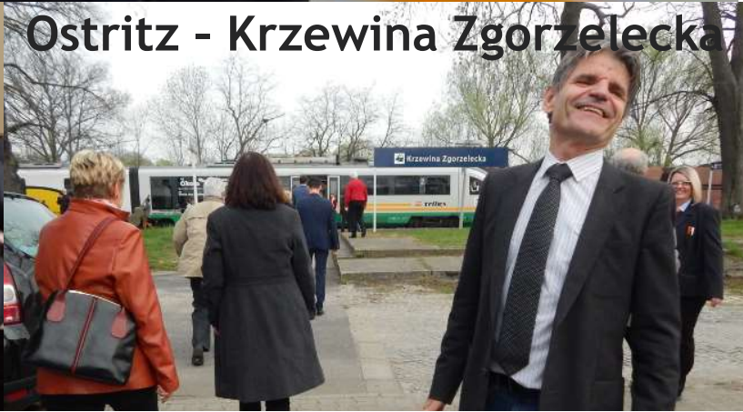
Ostritz - Krzewina Zgorzelecka