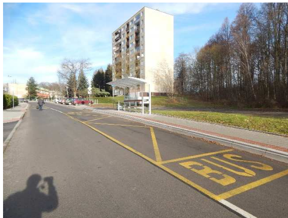
Obr: zastávka Frýdlant, „Bělíkova

V minulé výzvě Bezpečnost 2016 bylo více než 200 schválených žádostí 7 zaměřeno jmenovitě na autobusové zastávky a přístupy k nim. Další akce v sobě mohly autobusové zastávky zahrnovat. V Libereckém kraji se z této výzvy zrealizovali např. již v roce 2016 chodníky v ul. Bělíkova ve Frýdlantu včetně autobusové zastávky (výše podpory 2 668 000 Kč). V současné době realizuje rekonstrukce zastávky Chotovice, hl.sil. a přilehlého úseku chodníků i samotné komunikace (výše podpory 1 362 000 Kč). Celý seznam více než 200 podpořených žádostí: Bezpečnost 2016 .